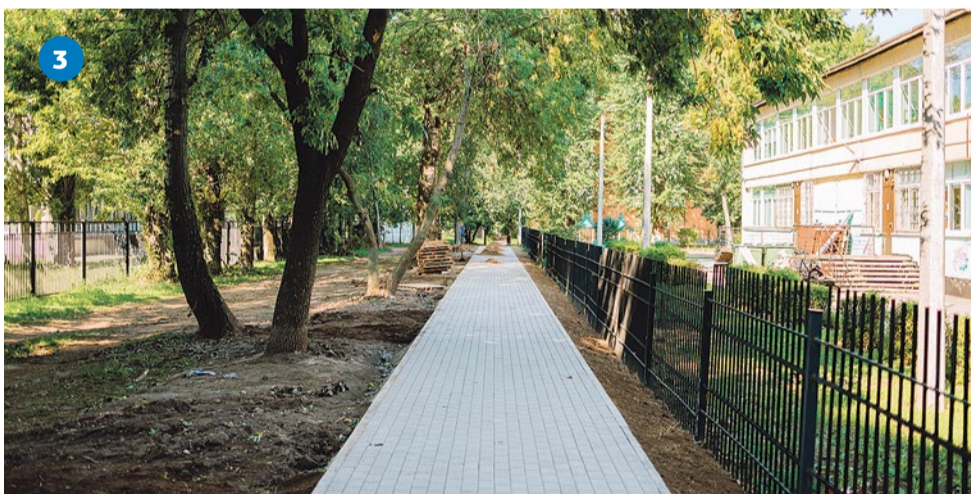
Новая пешеходная дорожка к школе № 295 на проспекте Славы, 40/5