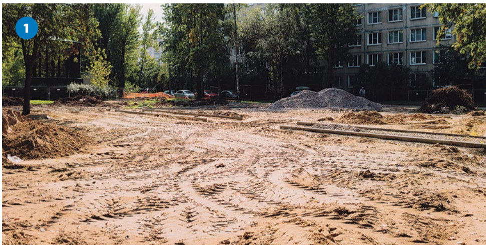
Подготовка к строительству дорожек и площадки на Бухарестской улице, 86/1

Сотрудники отдела благоустройства продолжили работу по очистке территории округа от автохлама. После обращения в администрацию Фрунзенского района были вывезены двухэтажный автобус с Южного шоссе и ВАЗ 2108 с Турку, 22/6 (фото 6).