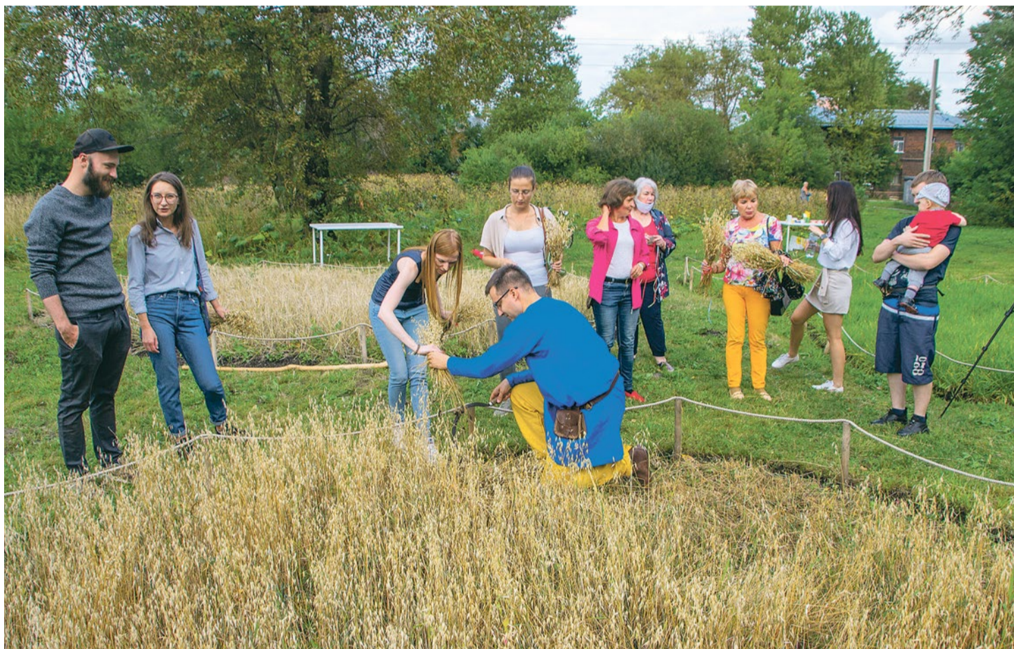
Жатва ячменя и овса на злаковом поле, Софийская улица, 20/4.