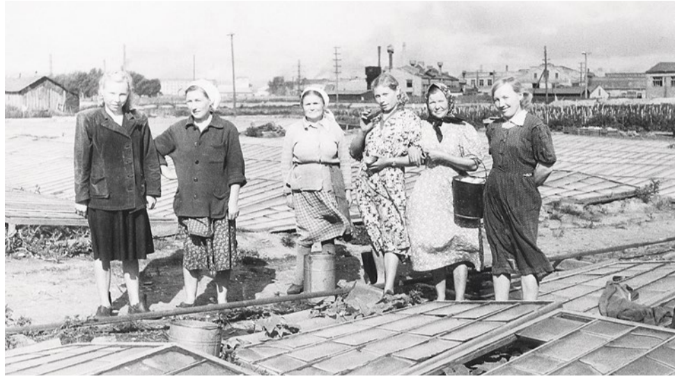
Работницы совхоза на фоне парников. Фото 1953 года из архива Клавдии Сергеевой

В сложнейшей обстановке совхоз в 1942 году поставленный перед ним