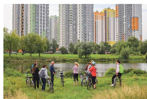
Велоэкскурсии длятся около пяти часов, а каждая остановка в пути – повод для подробного рассказа

Муниципальное образование № 72 выражает благодарность своему партнеру – бесстанционному прокату SmartBike, который на время экскурсии бесплатно предоставил велосипеды для жителей.