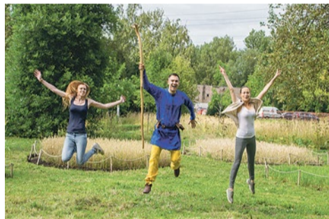
Праздник жатвы на Злаковом поле за домом 20/4 на Софийской улице