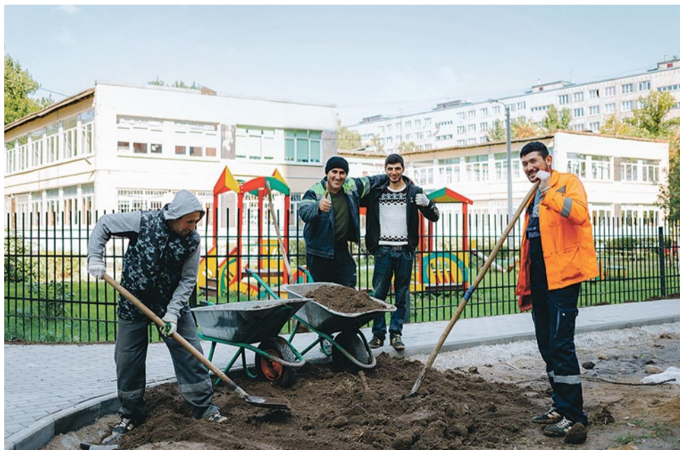
Строительство новой пешеходной дорожки к школе № 295 (проспект Славы, 40/5)