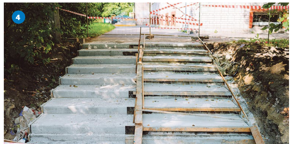
Лестница к поликлинике № 56 на Пражской улице, 40