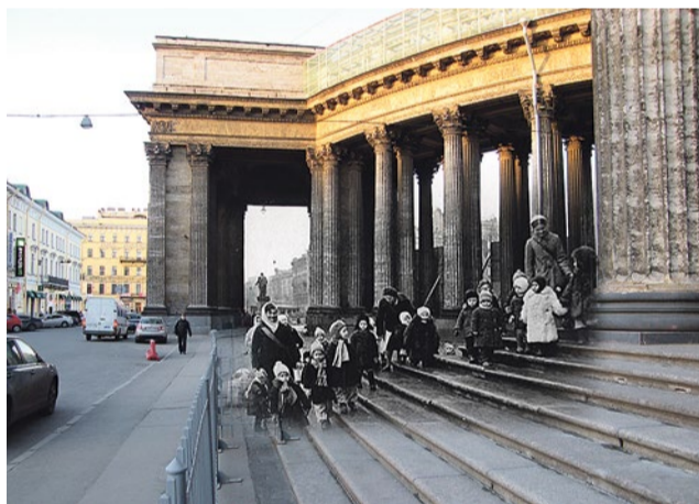
Ленинград 1941–2009. Дети у Казанского собора