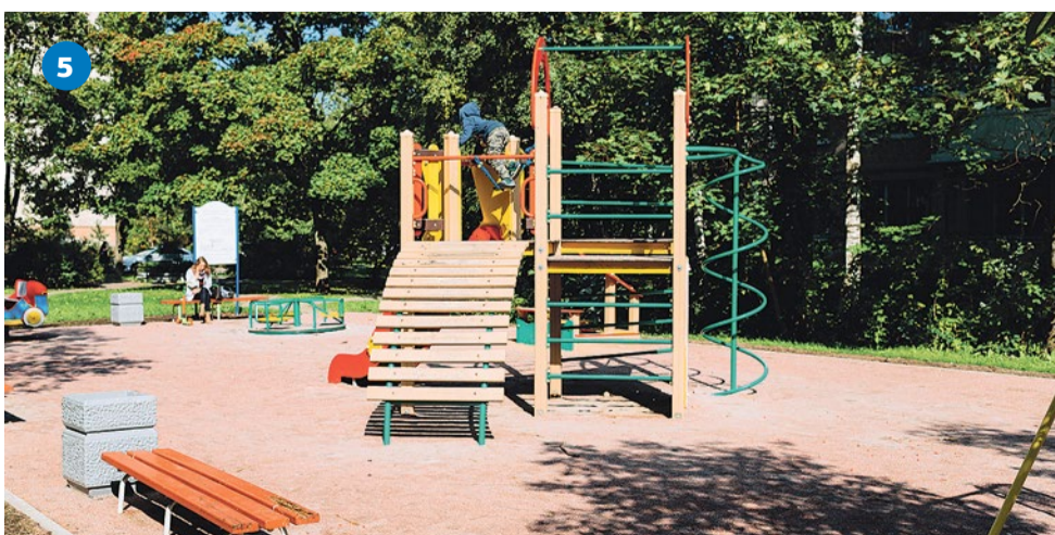
Обновленное покрытие детской площадки на Бухарестской улице, 94/4