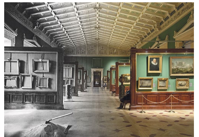
Ленинград 1941–2015, Эрмитаж. Шатровый зал (Зал 249)