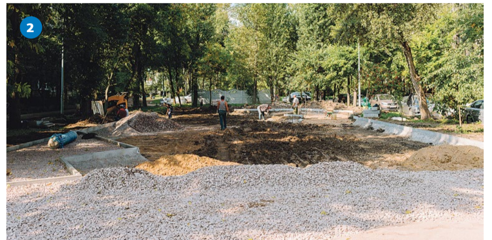
Подготовка к строительству площадки на Софийской улице, 20/3–20/4