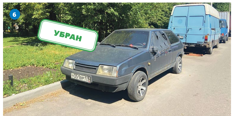
ВАЗ 2108 на улице Турку, 22/6